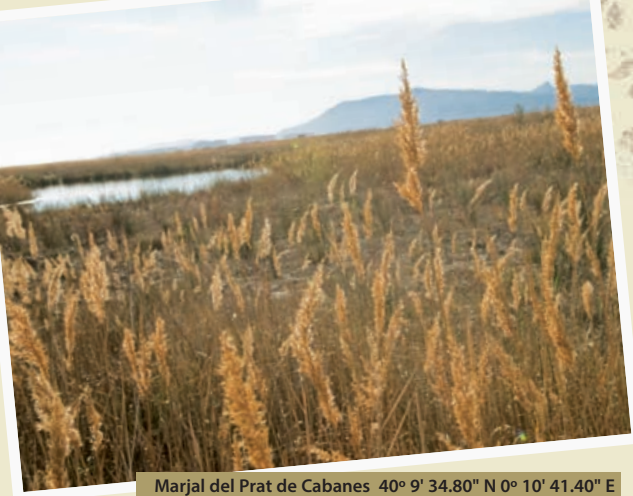
Marjal del Prat de Cabanes 40° 9' 34.80" N 0° 10' 41.40" E