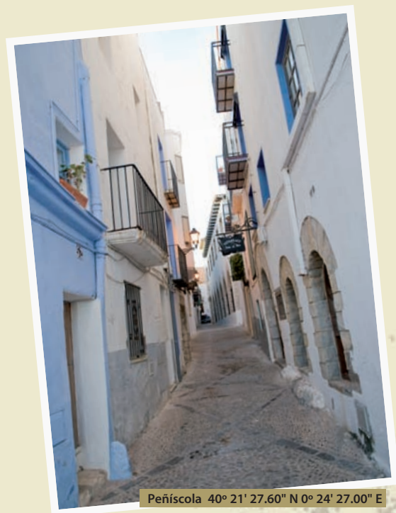
Peñíscola 40° 21' 27.60" N 0° 24' 27.00" E

Comenzamos a andar por la Serra d'Irta y, nada más salir de Peñíscola, encontramos un camino que nos lleva a la ermita de Sant Antoni; lo tomamos y en este recorrido de cuatro kilómetros ya observamos el tipo de vegetación que nos va a acompañar durante este paseo