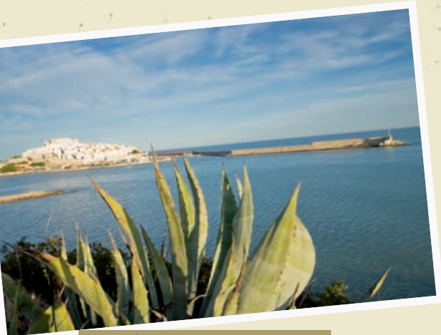
Peñíscola 40° 21' 16.20" N 0° 23' 53.40" E