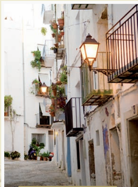
Peñíscola 40° 21' 27.60" N 0° 24' 27.00" E