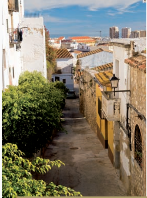
Oropesa del Mar, casco antiguo 40° 5' 30" N 0° 8' 3" E

En caso de querer recorrer la ruta tal como está planteada en bicicleta o a pie, atención: Es mejor una bici de montaña o, como mínimo, del tipo híbrida. No encontraremos demasiadas fuentes para saciar la sed fuera de los núcleos urbanos, por tanto debemos aprovisionarnos de agua siempre que tengamos ocasión tanto en la Serra d'Irta como en el Prat de Cabanes-Torreblanca. Tanto las primeras horas del día como el atardecer son los momentos más luminosos y agradables del día. La ruta se puede realizar en coche, por todas las pistas forestales que se proponen, aunque con vehículos todo terreno en las zonas de bosques o masías privadas. No se debe nunca abandonar el camino principal. Es mucho mejor para conocer cada zona de la naturaleza que proponemos al detalle, dejar aparcado el vehículo y realizar paseos a pie por los senderos homologados. No es transitable con coche el tramo por la restinga litoral de cantos rodados del Prat de Cabanes-Torreblanca.