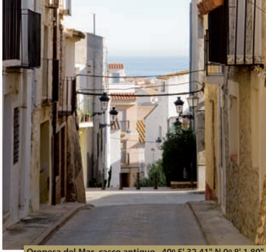
Oropesa del Mar, casco antiguo 40° 5' 32.41" N 0° 8' 1.80" E

Serra d'Irta, poseen un gran tamaño. Comenzamos nuestro recorrido y accedemos al Desert de les Palmes por el viejo camino que une Oropesa del Mar con Cabanes, remontando el valle de Miravet. Conviene hacer una parada en la font de Miravet para beber un poco de agua y contemplar un castillo cercano colgando de un cerro. Nos acercamos, por el valle de Miravet, a La ermita de les Santes, antes de introducirnos en el corazón de las montañas del parque natural. El entorno de la ermita, con su fuente de frescas aguas, muestra una exuberante vegetación de pinos, encinas y madroños. Los vecinos de Cabanes y la Poble Tornesa acuden puntualmente todos los años en procesión hasta este lugar de culto. Nos adentramos, ahora sí, en el valle central del Desert. Arriba las agujas de Santa Àgueda parecen estar cortando el cielo. Desde este punto podemos dirigirnos al pueblo de Benicàssim. Esta localidad es uno de los símbolos más emblemáticos de Castellón Costa Azahar. Benicàssim ha sido el destino turístico por excelencia debido, entre otras cosas, a sus muy estimables playas de arena. No podemos pasar por alto la zona de las Villas, edificios de veraneo de la burguesía que se construyeron frente al mar a partir de 1879. A lo largo de las últimas décadas del siglo XIX y las dos primeras del siglo XX se articuló un núcleo estival con edificios de estilos como el modernismo, clasicismo, racionalismo, estilo victoriano o tendencia popular.