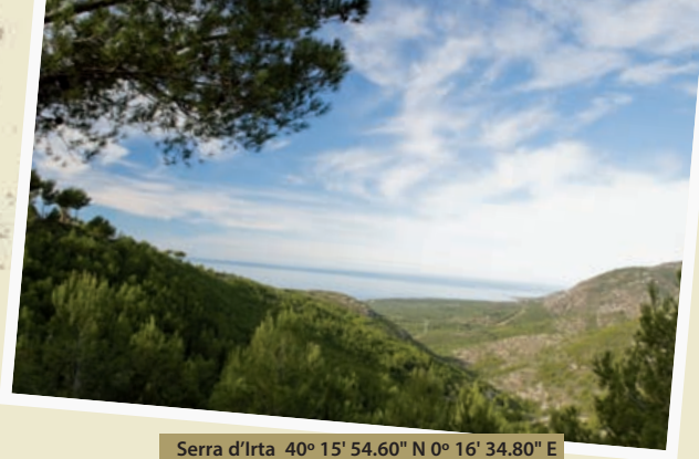
Serra d'Irta 40° 15' 54.60" N 0° 16' 34.80" E