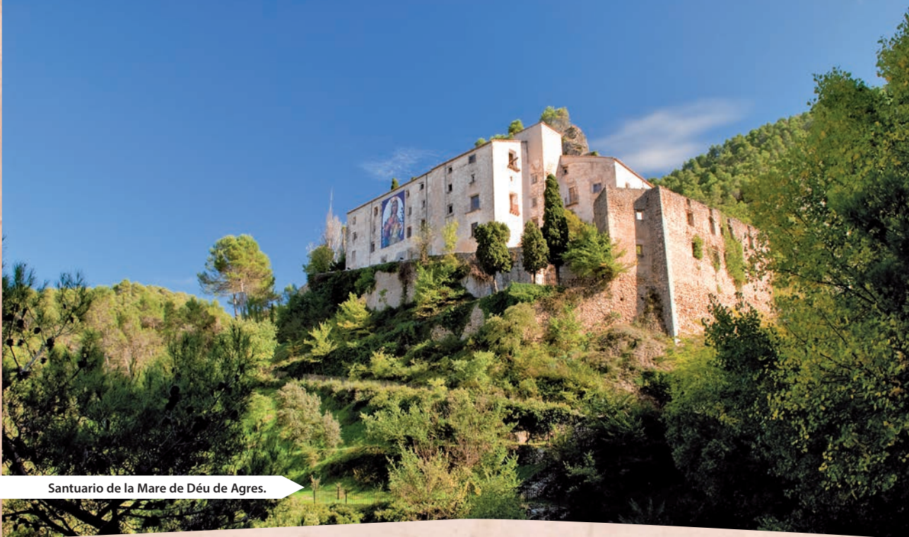
Santuario de la Mare de Déu de Agres.

cerca del refugio de montaña del Centro Excursionista de Alcoy. El interior tiene un diámetro de siete metros y una profundidad de diez metros.