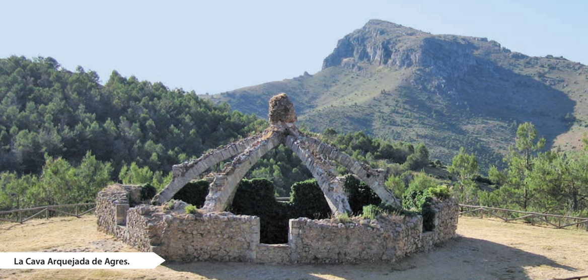
La Cava Arquejada de Agres.