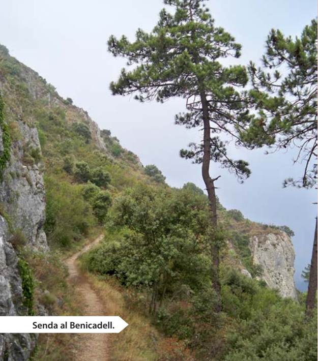
Senda al Benicadell.