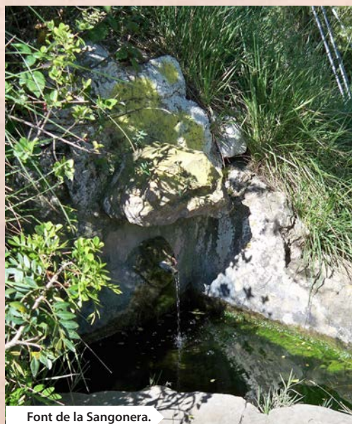
Font de la Sangonera.

Empezamos el descenso por la senda. Al poco nos encontramos con el enlace del PR-CV 40 que se dirige a la Font de la Granata y al paraje de Sant Llorenç. La bajada, ahora vertiginosa por el estrecho paso que permite el cortado, y que después de pasar un desprendimiento de rocas nos acerca