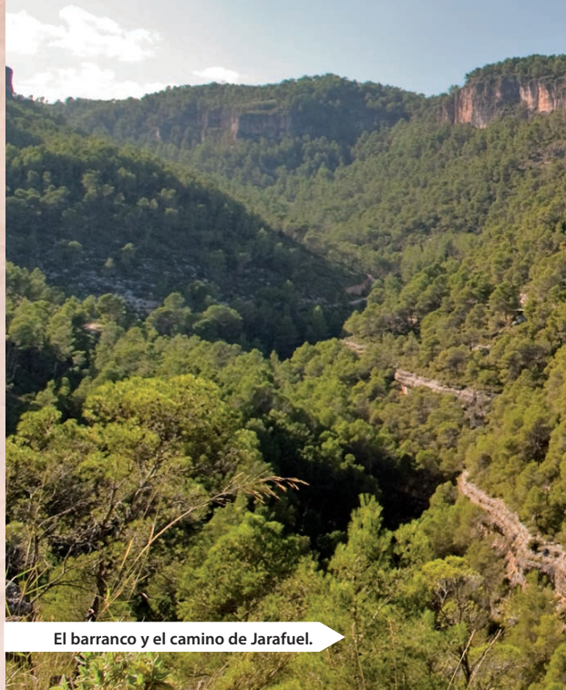
El barranco y el camino de Jarafuel.

vez que las tareas tradicionales de pastoreo y usos del bosque prácticamente se han extinguido. Rebaños de cabra ibérica pueden sorprendernos con la viveza de sus movimientos, habitantes del roquedo, comparten con el jabalí el rango superior de los mamíferos, y la avifauna como emblema de la pureza del cielo y los paisajes de la soledad y el silencio del Caroiig. El barranco Moreno es parte consustancial de este paisaje libre e interviene en la pintoresca composición urbana de Bicorp, rodeando con al abrazo de un cerrado meandro al caserío, apiñado sobre un cerro, en la encrucijada medieval de calles y plazuelas, en lo que fue una alquería musulmana ganada por el rey Jaume I, de nombre Abu Karb, de más que supuesta etimología árabe y origen antroponímico.