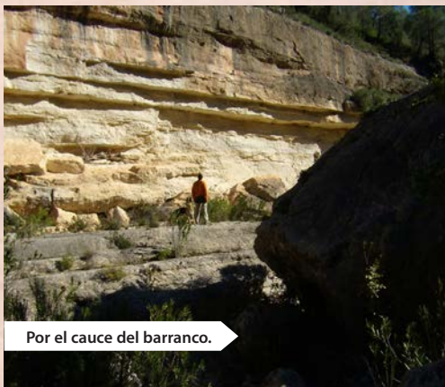
Por el cauce del barranco.

Punto de partida y llegada: Bicorp en el corazón del macizo. La población se emplaza en el centro de una amplia depresión rodeada de montañas, de desniveladas tierras agrícolamente bien aprovechadas, secanos en bancales de ladera y regadíos, cítricos y hortalizas de sus bonitas huertas. Es una hoya en la cabecera de La Canal de Navarrés, continuidad comarcal de un rosario de espacios agrícolas y promisión humana que sin llegar a formar un valle configuran un corredor natural vertebrador de una unidad económico social de pueblos y tierras. Las montañas que ocupan por completo el extenso término de Bicorp, han restringido su expansión agrícola. Los ríos y barrancos, muelas y montes, extensa superficie forestal de densos pinares, son en la actualidad el libre espacio de la fauna salvaje, una