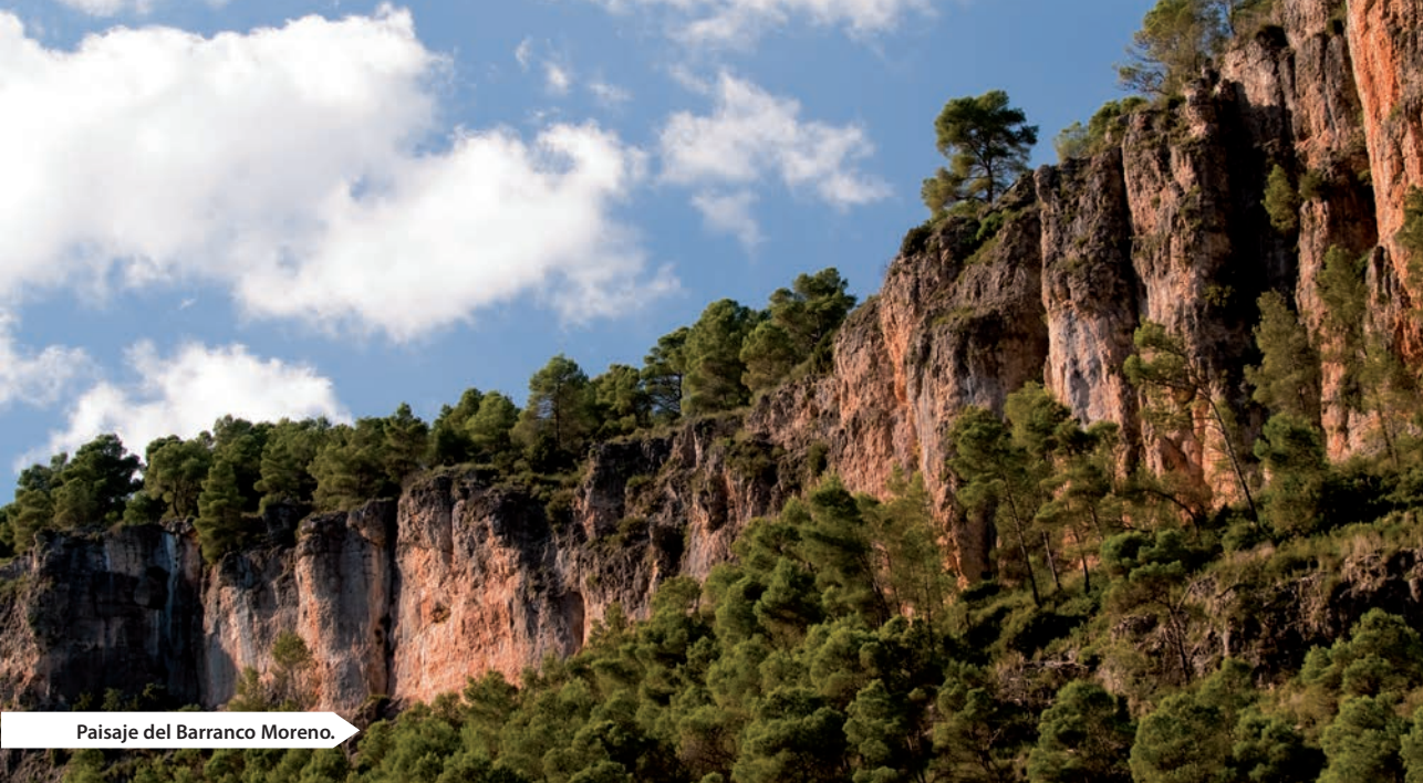
Paisaje del Barranco Moreno.

vegetal o mineral, en sus mínimas expresiones, a diferencia de las cumbres, escenario por excelencia de la contemplación en la distancia.