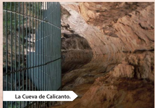
La Cueva de Calicanto.

Cavidad alargada de erosión, con una balsa en su interior de pequeñas dimensiones de recogida de agua de un pequeño manantial. Se puede observar unos frisos decorados con diferentes figuras de animales y antropomorfos esquemáticos, entre los que hay un mayor número de figuras y representaciones rupestres, que son las más importantes del barranco. Existen, además, otros abrigos decorados en la zona. La situación de la