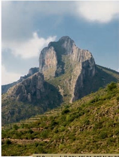
El Benicadell 38° 49' 31.80" N 0° 22' 47.40" W

especialmente, en la Comunitat Valenciana, primera zona papelera durante algunas décadas en la elaboración del papel de fumar. El Museu Valencià del Paper es también un museo vivo y, en este sentido, se realizan demostraciones con la elaboración manual de papel, proyección de documentales, edición de obras de tema papelero o exposiciones. Dejamos la localidad de Banyeres de Mariola y, desde la extinta estación ferroviaria del pueblo, retomamos nuestro itinerario por la plataforma de la vía verde.