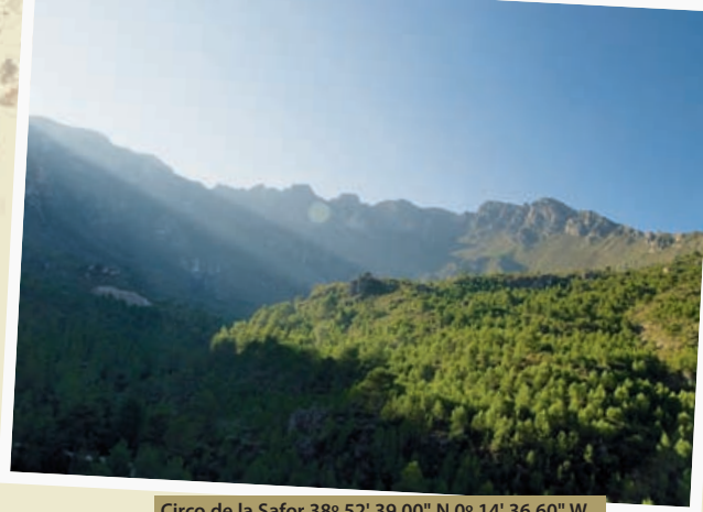
Circo de la Safor 38° 52' 39.00" N 0° 14' 36.60" W

Bajamos de la serra de Mariola y continuamos nuestro recorrido por la plataforma de la vía verde hasta Muro de Alcoy. Esta parte del trazado transcurre entre trincheras con la densa vegetación de las estribaciones del parque natural de la serra de Mariola. Nos encontramos con algunas infraestructuras propias del ferrocarril ya en desuso, como pozos o casillas de control. Abandonamos la frondosidad del monte y, tras una curva, se abre ante nosotros el valle de Alcoy. Nos detenemos en la localidad de Muro de Alcoy y abandonamos la vía verde de la Xixarra para tomar ahora la vía verde del Serpis, transitada en su época por el tren dels anglesos . En Muro de Alcoy podemos visitar entre otros lugares de interés el monumento en honor a El Tío Pep, conocido por una famosa canción popular a lo largo y ancho de la Comunitat Valenciana. La estatua está situada a la entrada del pueblo.