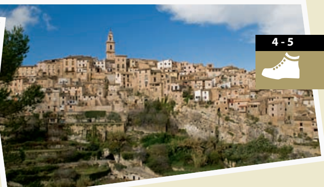
Bocairent 38° 45' 58.20" N 0° 36' 25.20" W