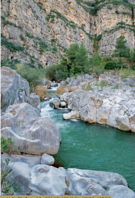
Barranc de l'Infern 38° 52' 45.60" N 0° 15' 29.40" W

alberga, en su interior, el Aula de Latinidad o Aula de Gramática, construida bajo el patrocinio de Gregorio Mayans en el siglo XVIII y que hoy sirve como aula de estudio y para la realización de cursos para adultos. Tras una visita a la playa tomaremos dirección suroeste para conocer el marjal de Pego-Oliva. Se trata de una antigua albufera que, debido al avanzado proceso de colmatación, presenta el aspecto actual. Este parque natural comprende una extensión de 1.290 hectáreas. Se encuentra rodeado por las sierras de Mostalla, Migdia y Segària, que forman una herradura abierta al Mediterráneo. Es un sistema pantanoso instalado en la zona más deprimida, con poca pendiente y a nivel del mar: una zona de almacenamiento y descarga de aguas subterráneas que atenúan así los efectos de las inundaciones y regulan la calidad del agua. Dos cursos fluviales de aguas abundantes, el río Bullent y el Molinell o Racons, rompen y traspasan el cordón litoral permitiendo el natural desagüe de las cuantiosas aguas de los manantiales y fuentes, manteniendo así el ciclo y el equilibrio hídrico en el parque. En las zonas del parque inundadas y de más profundidad sorprenden los cañaverales, con las cañas y la anea