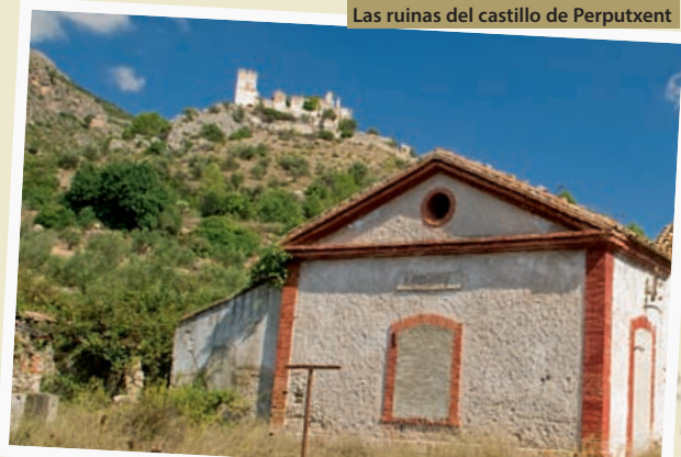
Las ruinas del castillo de Perputxent