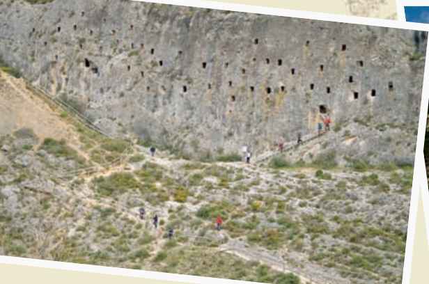
Les Covetes dels Moros. Bocairent 38° 46' 11.40" N 0° 36' 30.00" W