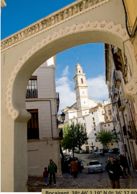
Bocairent 38° 46' 1.19" N 0° 36' 37.80" W

transformado posteriormente a lo largo de los siglos y restaurado en el siglo XX de manera ejemplar. No será el único castillo que visitaremos durante este trayecto. En Biar, siguiente población por la que discurre la vía verde, también encontramos uno declarado Bien de Interés Cultural. Desde el castillo de Biar emana un laberinto de calles estrechas y empinadas. Y en la siguiente localidad, Campo de Mirra, también nos detendremos en su afamado castillo de Alzmira, del que sólo queda en la actualidad el torreón. En este castillo se firmó, en el año 1244, el Tratado de Almirra, mediante el cual Alfonso X El Sabio, rey de Castilla, y Jaime I de Aragón delimitaron las fronteras de sus respectivos reinos. Estas fronteras fueron, a lo largo de los siglos, el punto de fricción entre los posteriores reinos de Castilla, Murcia y Valencia. Este hecho justifica el poderío y la enjundia de los castillos de la zona del Vinalopó, entre los que destacan, además de los tres ya comentados, los de Banyeres de Mariola, Castalla, Sax o Petrer. Dejamos la localidad de Campo de Mirra y, recorriendo una distancia corta, llegamos a Beneixama, localidad que da nombre al valle donde nos encontramos, entre las sierras de La Solana y Fontanella. De Beneixama, abandonando la vía verde en un recorrido de ida y vuelta, atravesando