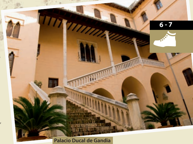
Palacio Ducal de Gandia

con sus más de mil metros de altura, se abre ya hacia el litoral. No debemos perdernos una aproximación a las laderas de esta mítica montaña desde las cercanías de Villalonga. Desde su cima se disfruta de una espectacular vista panorámica del cercano litoral de La Safor. Nos remitimos a las palabras del excursionista José Soler Carnicer que dice de esta montaña. "Las características casi pirenaicas de este Circo de la Safor, que se abre en abanico, formando una angosta herradura, cuyas paredes son enormes crestones de roca, provocando la admiración al contemplar este magno anfiteatro, rematado por colosales murallas rocosas". Seguimos avanzando por la vía verde y nos encontramos con la Fuente de la Reprimola con sus dieciséis caños. Son aguas de buen beber en un rincón del río Serpis, muy querido por los vecinos del pueblo de Villalonga. En este punto del camino los montes ya se han abierto y a pocos kilómetros nos encontramos con el municipio de Villalonga, ya en la llanura de la Safor. El conjunto urbano de este municipio es tranquilo y agradecido para dar un paseo por sus calles estrechas y apacibles plazas. Después de Villalonga el valle del Serpis se abre dando paso a los cultivos de regadío, pequeñas huertas y campos de cítricos. Antes de llegar al siguiente pueblo, Potríes, el Serpis nos vuelve a regalar otro bello rincón en el azud de Villalonga. Llegados a Potríes debemos visitar la casa-ayuntamiento, localizada en un imponente